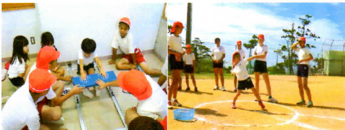
写真3 新体力テストの様子

新体力テストにチャレンジすることによって、現在の自分の体力・運動能力がどのくらいあるのが確認できるとともに、年齢に応じて5段階(A~E)の評価もつけられます。