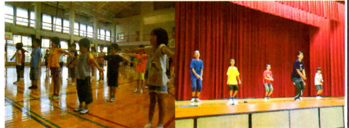
写真4 がんじゅうたいむの様子