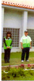
写真2 朝のあいさつ運動